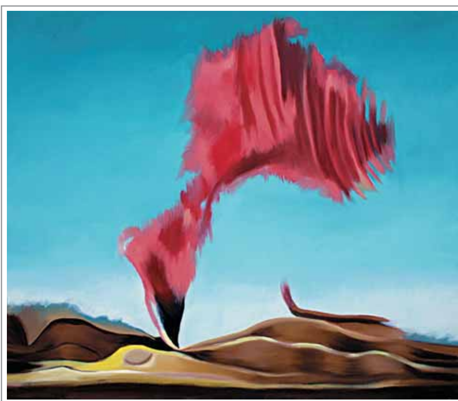
Lidia Pizzo, 70x60 cm, olio su tela

«...un sonnecchiante vulcano... pronto a esplodere in tutta la sua forza inarrestabile...» (cfr. pagina 174)