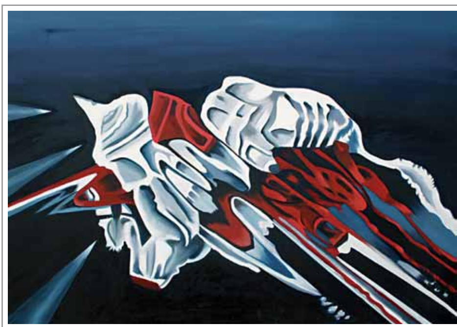
Lidia Pizzo, 90x70 cm, olio su tela

«... ti spezzo la schiena comu a na palumma.» (cfr. pagina 23)