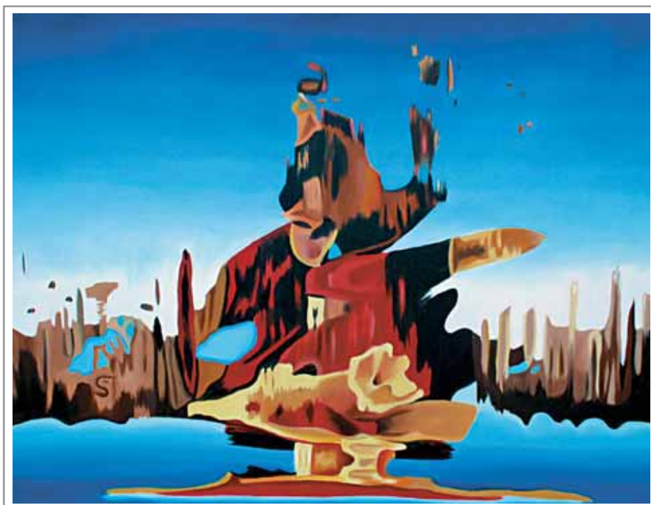
Lidia Pizzo, 80x60 cm, olio su tela

«... un uomo violento e dedito al bere.» (cfr. pagina 89)