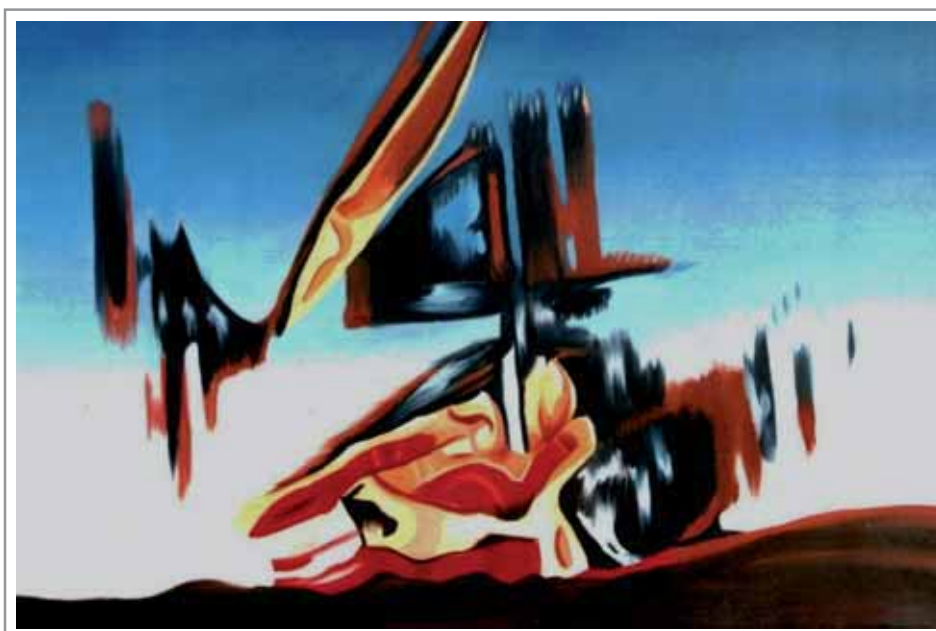
Lidia Pizzo, 70x50 cm, olio su tela

«... forse non era impossibile penetrare il suo mondo!» (cfr. pagina 107)