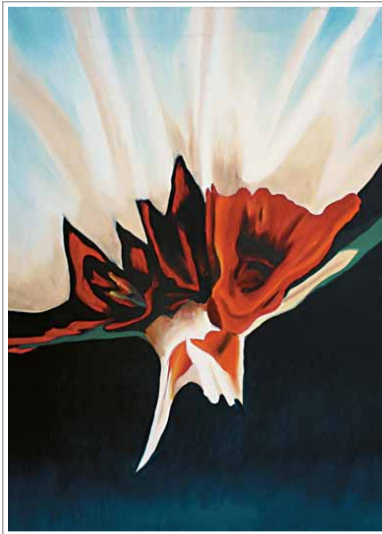
Lidia Pizzo, 70x50 cm, olio su tela

«... È bella come un fiore! Un fiore senza vita al quale hanno reciso il gambo.» (cfr. pagina 72)