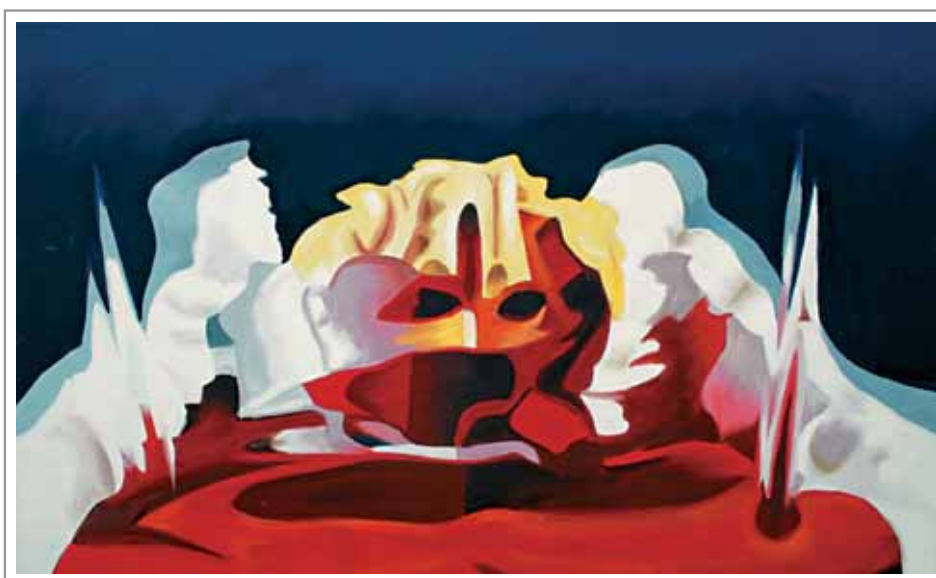
Lidia Pizzo, 90x60 cm, olio su tela

«Non c'è luogo dove si possa andare se dentro di noi restano sepolti fantasmi...» (cfr. pagina 136)