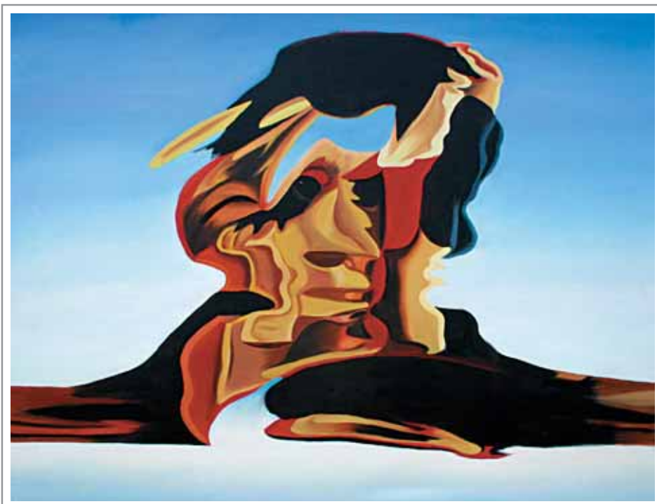
Lidia Pizzo, 100x80 cm, olio su tela

«... sembrava un lupo pronto a ghermire la preda.» (cfr. pagina 181)