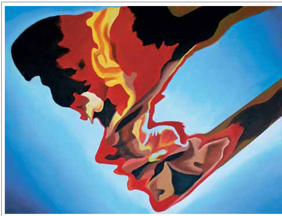
Lidia Pizzo, 80x50 cm, olio su tela

«Cosa esprimono questi lineamenti perfetti all'interno e frantumati all'esterno?» (cfr. pagina 111)