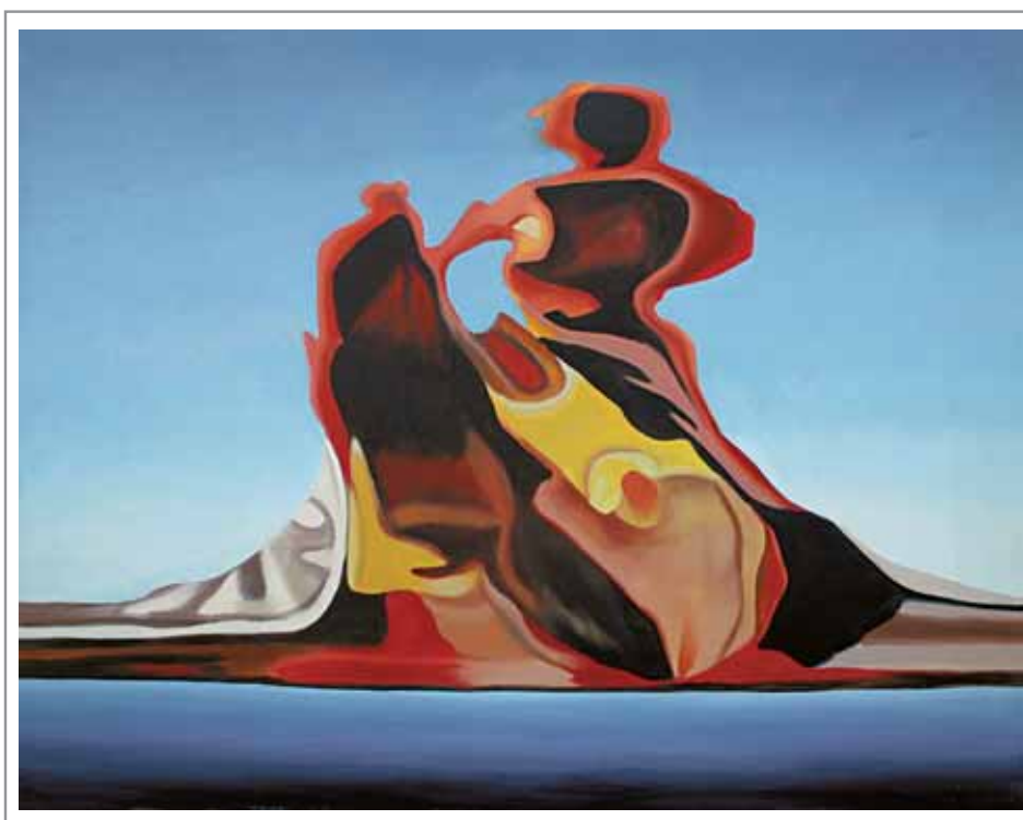
Lidia Pizzo, 90x70 cm, olio su tela

«Sono le idee a muovere il mondo...» (cfr. pagina 55)