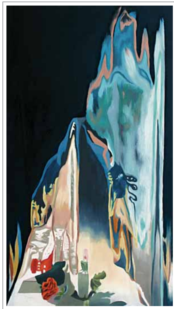
Lidia Pizzo, 80x50 cm, olio su tela

«... quella porta oscura che ci tiene rinchiusi dentro di noi e ci impedisce di andare oltre.» (cfr. pagina 136)